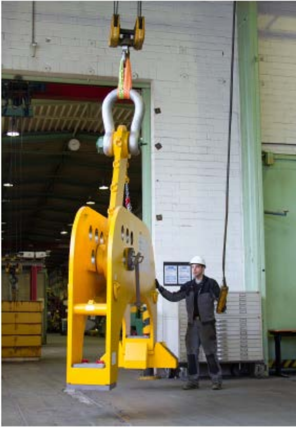
Рис. 1: Короткий строп Magnet-X: Незаменимый при небольших высотах подъема и чрезвычайно компактный благодаря использованию высокопрочных нитей.