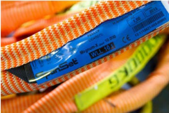
Рис. 3: Уникальная износостойкая и устойчивая к порезам бирка. Вшитый в манжету стропа Magnet-X с применением износостойкого и стандартный RFID чип упрощает работу с тестовой документацией.